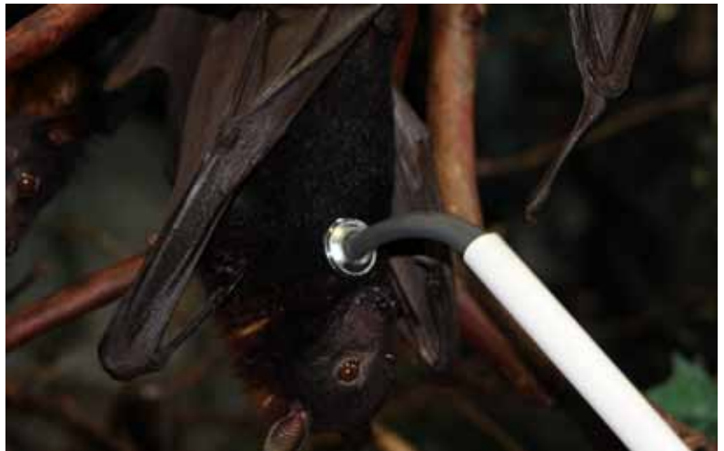
A utilização de técnicas de condicionamento como ferramenta para facilitar o manejo veterinário.

O melhor exemplo disso foi o condicionamento de seis exemplares de raposas-voadoras ( Pteropus vampirus ), que agora aceitam o toque, palpação, auscultação, colocação de máscara anestésica e muito mais. Desde a inauguração do aquário, sempre houve a grande preocupação com a diminuição do estresse e do bem-estar do animal cativo, mas somente agora com a