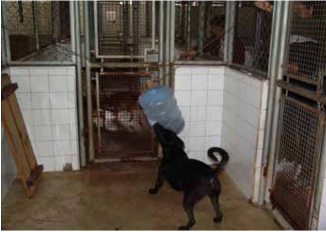
Pouco gasto, reciclagem e boa vontade mudam o cotidiano de cães em confinamento no CCZ-SP, após workshop do SHAPE

www.enrichment.org shapebrasil@gmail.com E no FACEBOOK!