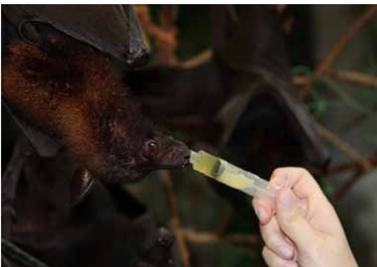
A relação profissional-animal deve ser estimulada através do treinamento e condicionamento.

assessoria do SHAPE Brasil conseguimos atingir alguns de nossos objetivos, como a junção de dois casais do rato-do-banhado, acompanhamento do comportamento e pico de atividade de: tubarões-lixia ( Ginglymostoma cirratum ), filhotes de tamanduá-mirim ( Tamandua tetradactyla ) e de lontra ( Lontra longicaudis ), um lobo-marinho-subantártico ( Arctocephalus tropicalis ), de um peixe-boi da Amazônia ( Trichechus inunguis ) e dos pingüins-de-Magalhães ( Spheniscus magellanicus ).