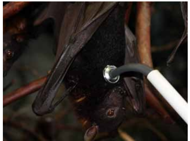
SHAPE Brasil atua no aquário de São Paulo com as Raposas-voadoras, entre outras espécies.

workshop visando desenvolver a criatividade para garantir qualidade de vida para os animais, enquanto eles aguardam um novo dono. Páginas 6 e 7